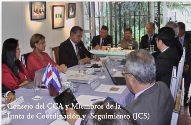
Consejo del CCA y Miembros de la Junta de Coordinación y Seguimiento (JCS)